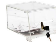
Urna rectangular con llave 22 x 12,7 x 17 cm Ref. 14114