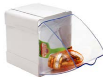
Caja con 1 cajón 12 x 14 x 12 cm Ref. 14111