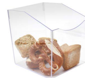
Cesta cuadrada 29 x 25 x 20 cm Ref. 33521