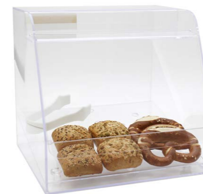
Vitrina bollería transparente 40 x 37,5 x 35 cm Ref. 3351