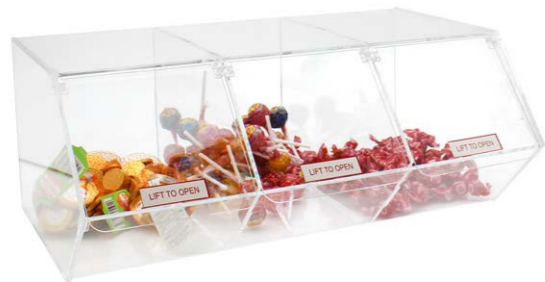
Caramelera con 3 cajones con tapa 49,5 x 20 x 32,5 cm Ref. 3350