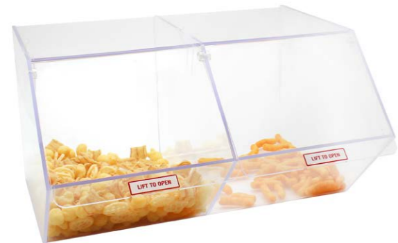
Caja con 2 cajones para golosinas 49,5 x 28 x 27 cm Ref. 3363