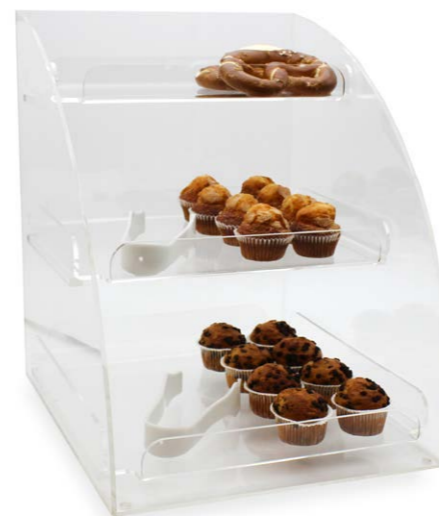
Caja 3 estantes bollería 50,4 x 50 x 45 cm Ref. 14113

¡Cajas y carameleras transparentes para una mejor visualización!!