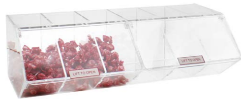
Caja con 6 tapas transparente 50 x 15 x 23 cm Ref. 3364