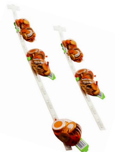
Tira para colgar golosinas 87,5 x 6 cm Ref. 3406