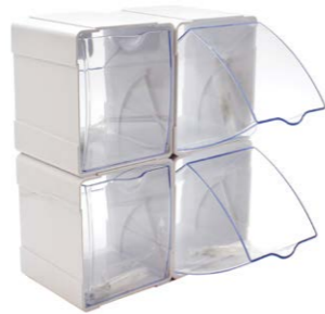
Caja con 4 cajones 24 x 28 x 12 cm Ref. 14112