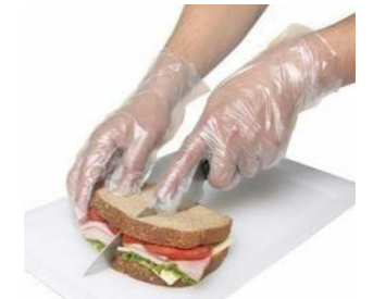
Guantes de plástico 100 unidades Ref. 91022