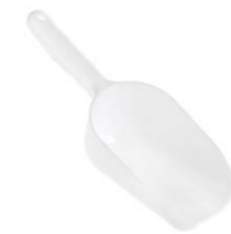
Pala pastelería plástico Ref. 33531