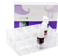
Caja 15 huecos 20 x 5,5 x 12,5 cm Ref. 140704