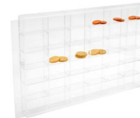
Caja 36 huecos 24 x 3,5 x 35 cm Ref. 3640T