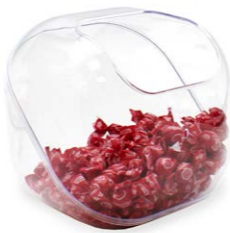
Cubo expositor pared/sobremesa 20 x 20 cm Ref. 3364